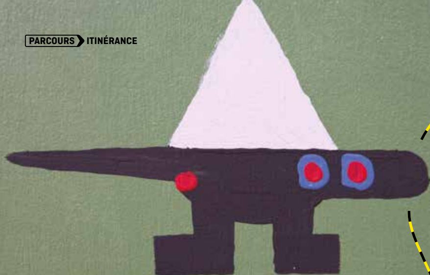
Détail d'une fresque de Paul Loubet et d'Adrien Fregosi, 2019